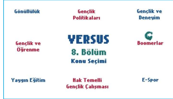
Versus #8: Gençlik ve Öğrenme 10

Kuruluşun temsilcileri Versus’u gençlik çalışmasının arşivine/belleğine önemli bir girdi olarak görmektedir. Bu video dizisinin interaktif özelliği sayesinde izleyenler tartışmalara anketler ve sorular yoluyla katılma olanağı bulmuştur. Aynı zamanda, gençlik alanına ilgi duyan ya da bu alanda çalışmak isteyen herkes için ulaşılabilir, “her daim geçerli” bir araç olarak değerlendirilmektedir. Soruları yanıtlayanlar ayrıca Versus’un iki önemli sonucu olarak kuruluşun görünürlüğünde artıştan ve teknik ve dijital kapasitesindeki gelişmeden söz etmişlerdir.