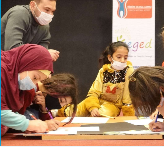
KEGED'in Gaziantep'te geçici koruma altındaki Suriyeli çocuklarla atölye çalışması.

Kimi başka durumlarda kuruluşlar, örneğin KEGED ve Pi Gençlik Derneği planlanmış yüz yüze etkinliklerini yeniden başlatmak üzere girişimde bulunmuş, bu amaçla anketler yoluyla potansiyel katılımcılarının görüş ve teyitlerine başvurmuş, hazır olma ve etkinliği katılma açısından isteklilik durumlarını hesaba katmıştır . Katılımcılardan gelen olumlu yanıtlar üzerine kuruluşlar yüz yüze etkinliklerini sürdürmeye başlamıştır. Görüşülenlerin belirttiğine göre, etkinliklere katılım için başvuruların sayısı gerçekten her zamankine göre daha düşük olmuştur; bunun nedeni, gençlerin (kimi zamanlarda ise daha çok aile büyüklerinin) enfeksiyon riskinden çekinmeleri ya da yaşadıkları ailelerde halihazırda koronavirüs vakaları olmasıdır. Buna rağmen, katılım için olumlu yanıt verenlerin sahiplenici tutumları gençlik kuruluşlarını etkinliklerin düzenlenmesi yönünde cesaretlendirmiştir. Ek olarak, belirtildiğine göre, bir katılımcının etkinlik için bir kentten diğerine yolculuk yapmasının mümkün olmadığı durumlarda etkinliğe daha fazla sayıda yerel genç katılmıştır.