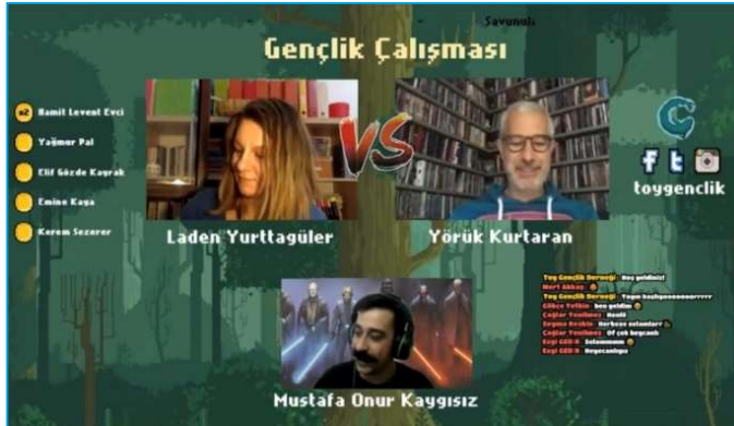
Versus #7: Gençlik Çalışması 9

“Versus” gençlik çalışanlarının gündelik çalışma pratiklerinde karşılaştıkları aynı sorulara farklı yaklaşımlar ve perspektifler geliştirilmesinde sanal bir alan yaratılmasını amaçlamıştır. Gençlik çalışmasında tek bir yanıt/yaklaşım olamayacağına kabulüyle, gençlik çalışması alanında deneyim sahibi olanları, bu alandaki araştırmacıları ya da eğiticileri, belirli bir konuda zaman zaman birbirine ters de olabilecek görüşlerini ifade etmek üzere bir araya getirecek videolar hazırlanmıştır. Versus’un 10 bölümünde tartışmaya açılan konular şunlardır: Haklara dayalı gençlik çalışması, uluslararası gençlik hareketliliği, gençlik ve spor, gençlik ve deneyim, gönüllülük, gençlik kuruluşlarına katılım, gençlik çalışması, gençlik ve öğrenme, gençlik çalışanı ve gençlik çalışmasında yerelleşme. Videolardan her biri 70-90 dakika uzunluğundadır ve videolarda konuşmacıların girdilerinin yanı sıra izleyicilerin interaktif soruları ve bunlara moderasyon aracılığıyla verilen yanıtlar da yer almaktadır.