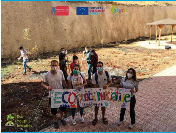
Gerekli güvenlik önlemleriyle birlikte GEGED’in dış ortamdaki projesi.

Kimi kuruluşlar, hedef gruptan gelen talep üzerine (Gaziantep Eğitim ve Gençlik Derneği – GEGED örneğinde gençlerin kendileri) yüz yüze etkinlikler düzenlemeyi sürdürmüştür. Görüşülenlerden kimileri, kendileriyle temasa geçenlerin gençler olduğunu ve kuruluşun pandemi döneminde yeni etkinlik düzenleyip düzenlemeyeceğini sorduğunu belirtmiştir. Görüşülenlere göre böyle bir talebin geri planında, kapanma önlemlerinin stresli ve hareketsiz konuma soktuğu gençlerin sosyalleşme ve hareket etme ihtiyacı yatmaktadır. Dolayısıyla kuruluş da böyle bir talebe olumlu yanıt vermiştir.