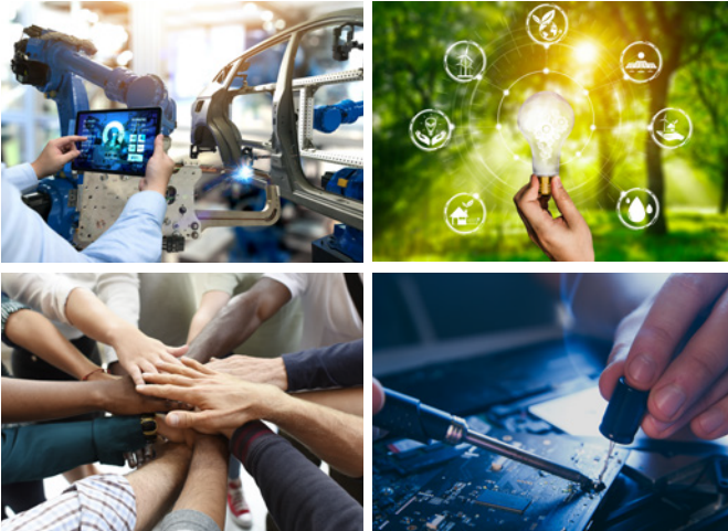
Resimler (üst soldan alt sağa): © zapp2photo, Blue Planet Studio, Rawpixel.com & burdun, stockadobe.com