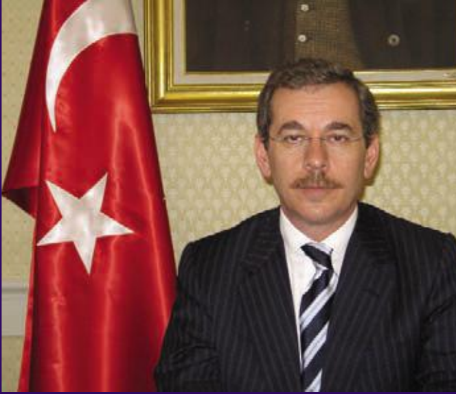
Doç.Dr. Abdüllatif ŞENER Devlet Bakanı ve Başbakan Yardımcısı