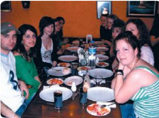
Hep birlikte Türk yemeklerini tadarken...

tatlılar. Sonra İsveçli öğrencileri ikişer ikişer Türk öğrencilerinin evlerine yerleştirdik ve iki gece Türk ailelerle beraber kaldılar. Her iki taraf için de önemli bir tecrübeydi. Bununla birlikte okuldaki öğretmenlere de Türkçe öğretmeyi ihmal etmedim. Her hafta Türkçe bir kelime ile karşısına da İsveççe karşılığını yazıp öğretmenler odasına astım. Böylece hem onlar hem de yeni bir dil öğrendik. Daha sonra kültür günüyapmaya karar verdik. Öğrencilerime folklor oynamayı öğrettim ve beraber Türk kına gecesini canlandırdık. Diğer tarafta da Türk yemekleri pişirdik. Önce yemekler tüm okula ikram edildi, ardından oyunumuzu sahneledik. Tüm görüntüler kamerasına alınarak okulun bağlantısının bulunduğu Tanzanya, Litvanya, Yunanistan ve Fransa'ya gönderildi. Bu programın bir amacı da ülkelerin tanıtılması olduğundan, bize özgü her özel günü değerlendirmeye çalıştım. Öğretmenler Gününde öğretmenler odasına bir afiş astım ve herkesin dolabına şeker paketleri yapıştırdım. Yanına da 'Öğretmenler Gününüz Kutlu Olsun' yazdım. Gözlerindeki sevinç görmeye değerdi ve yaptığım bu jesti hiç unutmayacaklarını söylediler. Bayramda da gelirken yanımda getirdiğim Türk lokumunu ikram ettim. O kadar çok hoşlarına gitti ki ben gelene kadar tadının ne kadar güzel olduğundan bahsettiler.