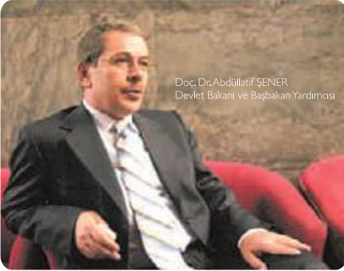
Doç. Dr. Abdullatif ŞENER Devlet Bakanı ve Başbakan Yardımcısı

19-20 Şubat tarihinde Hacettepe Kültür Merkezinde Türkiye'nin her yerinden gelen eğitim kurumu, işletme, özel ve resmi kuruluş temsilcilerinin katıldığı Hayatboyu Öğrenme Programı Bilgilendirme Toplantıları gerçekleştirildi. Genel Program Tanıtımının ardından Comenius, Grundtvig, Leonardo Hareketlilik ve Leonardo Yenilik Transferi ile ilgili paralel çalıştaylar gerçekleştirilerek 1000'in üzerinde potansiyel yararlanıcıya 2007 başvuruların doğrultusunda eğitim verildi.