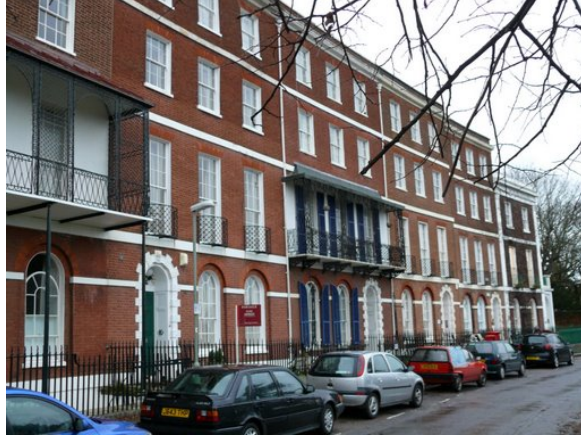
International Project Center-Kursun olduđu yer