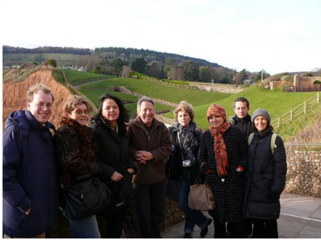
Exeter-Downtown Kursa katılan diđer öğretmenler